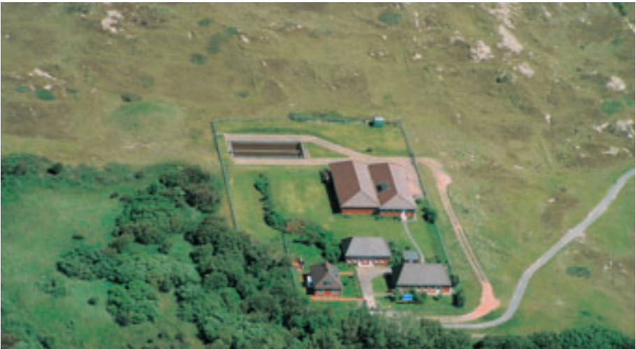
Wasserwerk II „Weiße Düne“