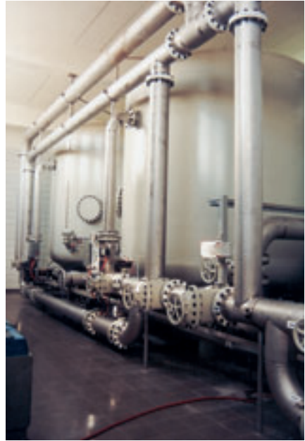
Geschlossenes Vorfiltersystem Wasserwerk II